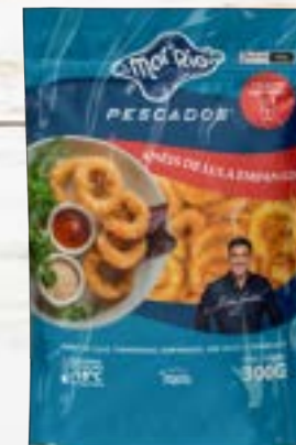
Anéis de Lula Empanado Cong.