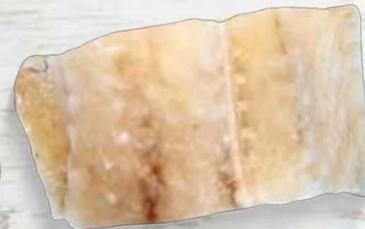
Bacalhau Dess. Lombo Churrasco Cong.