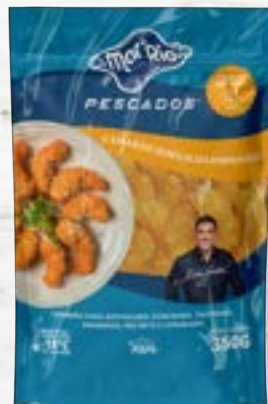
Camarão Cinza Emp. sem Cauda Cong.