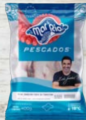
Posta de Piramutaba Cong. CÓD. PESO CAIXA RV000833 PCT 400g 20 unidades CÓD. PESO CAIXA PA000089 PCT 800g 15 unidades