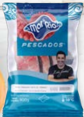
Tambaqui em Posta Cong. CÓD. PESO CAIXA PA000601 PCT 800g 15 unidades