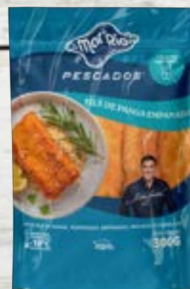
Filé de Pangásius Empanado Cong.