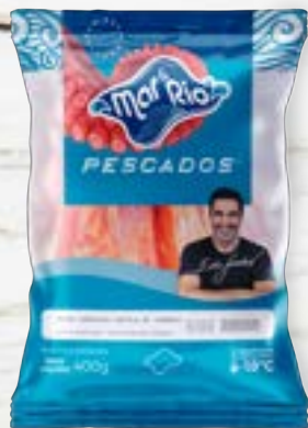
Costela de Tambaqui Cong. CÓD. PESO CAIXA PA000197 PCT 400g 20 unidades CÓD. PESO CAIXA PA000092 PCT 800g 15 unidades