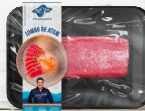
Peixe Resfriado Lombo de Atum em Ped. S/Pele