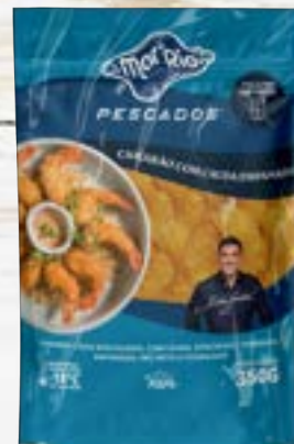
Camarão Cinza Emp. com Cauda Cong.