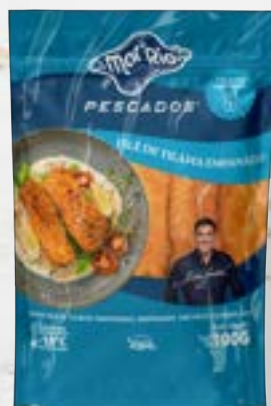
Filé de Tilápia Empanado Cong.