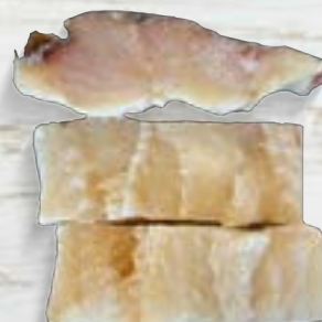
Lombo de Bacalhau Dess. Morhua Cong. - P