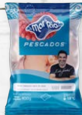
Cação em Postas Cong. CÓD. PESO CAIXA PA000019 PCT 800g 15 unidades