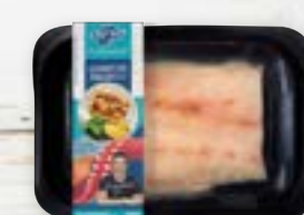
Lombo em Peçaço de Cação Cong.