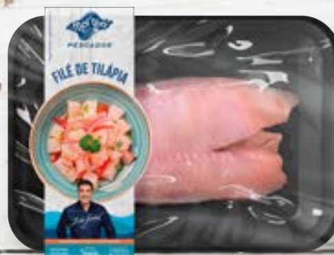
Peixe Resfriado Filé De Tilápia Sem Pele