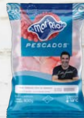
Pangasius em Postas Cong. CÓD. PESO CAIXA PA000650 PCT 800g 15 unidades