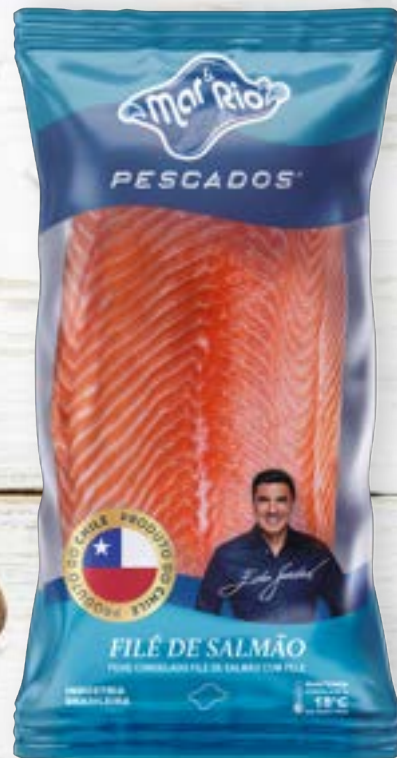
Filé de Salmão Inteiro à vácuo