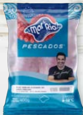
Porquinho Eviscerado S/Pele Cong. CÓD. PESO CAIXA PA000126 PCT 400g 20 unidades CÓD. PESO CAIXA PA000127 PCT 800g 15 unidades