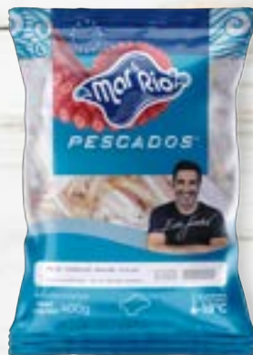
Manjuba Inteira Cong. CÓD. PESO CAIXA RV000855 PCT 400g 20 unidades CÓD. PESO CAIXA PA000091 PCT 800g 15 unidades