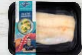
Filé em Peçaço de Pescada Cambucu Cong.