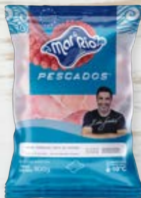
Posta de Pintado Cong. CÓD. PESO CAIXA PA000134 PCT 800g 15 unidades