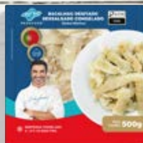
Bacalhau Dess. Desfiado Morhua Cong. - P