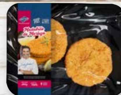
Medalhão de Merluza Empanado Cong.