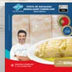
Posta de Bacalhau Dess. Morhua Cong. - S