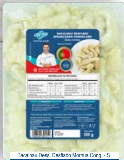
Bacalhau Dess. Desfiado Morhua Cong. - S