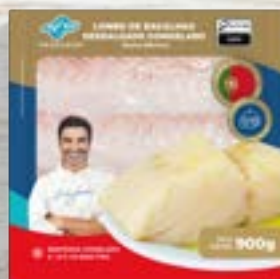
Lombo de Bacalhau Dess. Morhua Gourmet Cong. - P