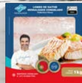
Lombo de Bacalhau Dess. Saithe Cong. - P