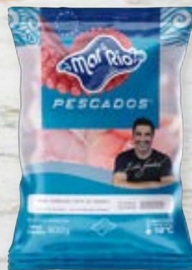
Posta de Surubim Cong. CÓD. PESO CAIXA RV000816 PCT 800g 15 unidades