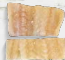
Posta de Bacalhau Dess. Morhua Cong. - P