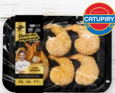
Camarão Cinza Emp. Rech. c/ Catup. Cong.