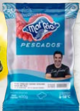
Pescada Espalmada Ovea Cong. CÓD. PESO CAIXA PA000045 PCT 400g 20 unidades CÓD. PESO CAIXA PA000046 PCT 800g 15 unidades