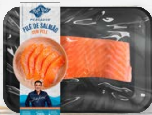
Peixe Resfriado Filé de Salmão em Ped. C/Pele