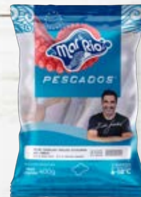
Merluza Cong. Evisc. HGT S/Cab. C/Pele CÓD. PESO CAIXA PA000484 PCT 400g 20 unidades CÓD. PESO CAIXA PA000485 PCT 800g 15 unidades