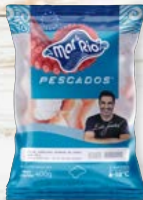
Pedacos de Cação em Cubos Cong. CÓD. PESO CAIXA PA000108 PCT 400g 20 unidades CÓD. PESO CAIXA PA000109 PCT 800g 15 unidades