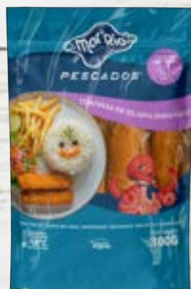
Tiras de Tilápia Empanado Kids Cong.