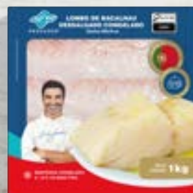
Lombo de Bacalhau Dess. Morhua Cong. - S